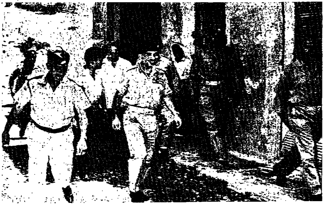
جلالة الملك العظيم وسمو الأمير حسن ولي العهد العظيم مع السيد سوتوكولم وزير الخارجية السوفياتي في زيارة مفاجئة للشونة الشمالية صباح أمس

بيان الى المواطنين نظرة لكثرة الكلمات الهادئة التي تلقاها «الدستور» أمس، من المواطنين الكرام، والتي اعربوا فيها عن تأييدهم للفكرة التي طرحها، ودعوتها فيها الى ايجاد التسامح وتوحد الكلمة والاحزاب التي تستهزئون في اسر مسكر الحمل الدولي في الاردن، فقد رأينا ان نبادر الى تسجيل أسماء الراغبين في المساهمة في هذه القضية الوطنية. يمكن الاتصال بهذه الغاية مع السكرتير الاداري لجمعية «الدستور»، صباح كل يوم، ما بين الساعة العاشرة والنصف صباحا واثنا عشر ظهرا، وسيتم السكرتير تسجيل اسم الضيف، وعنوانه، ورقم هاتفه (الواجب) واللغة الاجنبية التي يجيدها، وعدد الأشخاص الذين باستطاعته قبولهم للشباب. وستتولى مؤسسة رعاية الشباب، وادارة «الدستور»، بعد ذلك، تنظيم توزيع الصيوف على البيوت الاردنية، في مواعيد ستحدد بالاتفاق مع المواطنين القاطنين. («الدستور»)